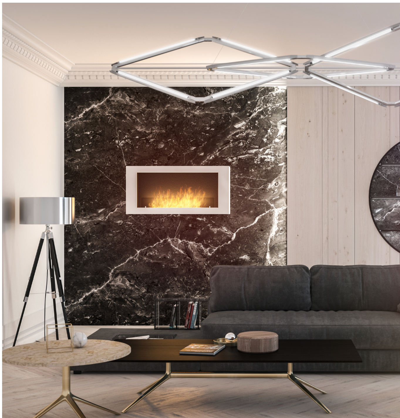
Biokominek Murall 1200